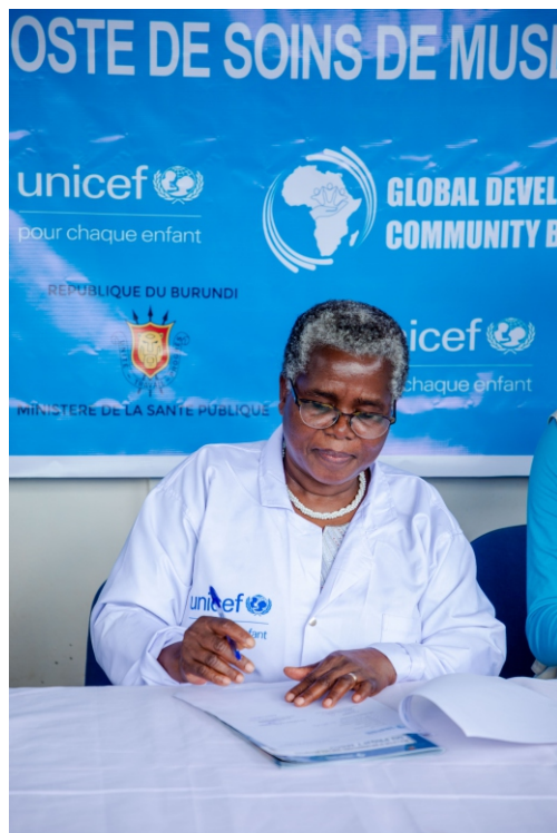
Son Excellence Dr Lydwine BARADAHANA Ministre de la Santé Publique au Burundi

Face aux défis sanitaires majeurs qu'a connus le Burundi, notamment l'épidémie de choléra et l'afflux massif des réfugiés congolais, la réponse nationale s'est articulée autour d'un leadership fort, d'une coordination efficace et d'une mobilisation collective des acteurs publics et humanitaires. Sous notre leadership, le secteur de la santé a démontré sa capacité à apporter des réponses concrètes, rapides et centrées sur les besoins des populations affectées, tant au sein des communautés hôtes que dans les sites d'accueil des réfugiés.